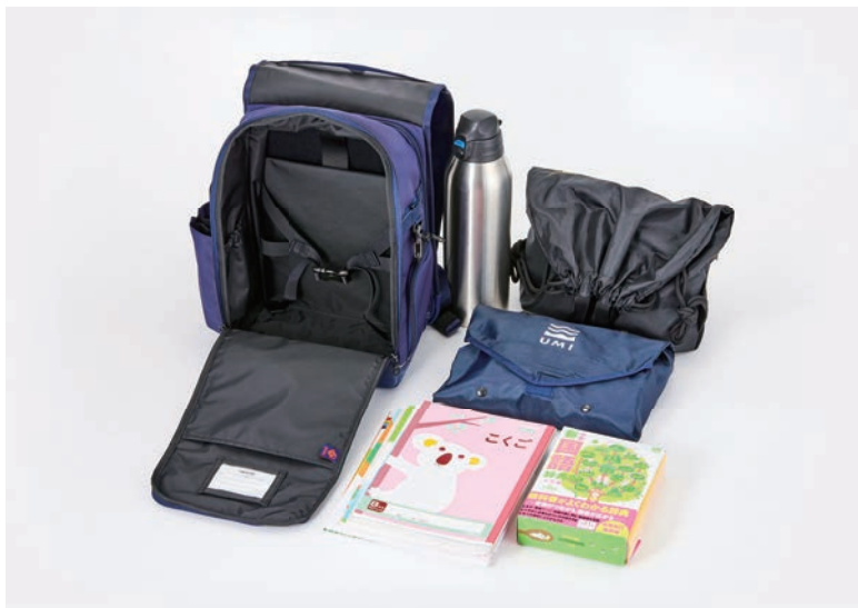
小学生の平均的な持ち物はこんなにたくさん