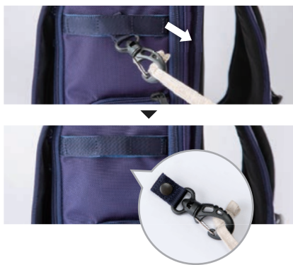
16. 安全機能付ナスカン

リュックのサイドについている安全機能付ナスカンは負荷がかかると外れる構造になっています。巻き込み事故を防ぎ安心。