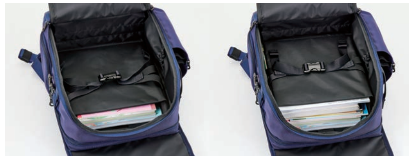
7. 可動式メイン収納間仕切り