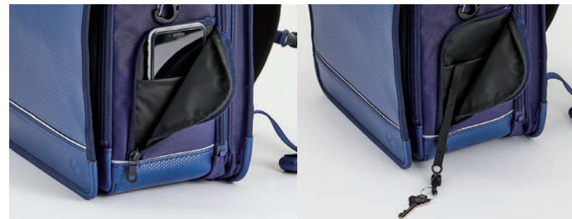
19. ファスナーサイドポケット (キッズ携帯ポケット)

※安全機能付ナスカンは、下向きには耐荷重1kg。横向きに力が加わった場合には、安全上外れやすい仕組みになっています。