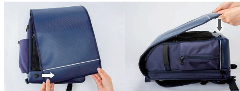
23. 開閉かんたんマグネットフック

開け方: かぶせの両端を両手で持ち、右へスライドするとかぶせが外れます。 閉め方: かぶせを上からまっすぐに下ろすと、マグネットが作用しパチンと閉まります。