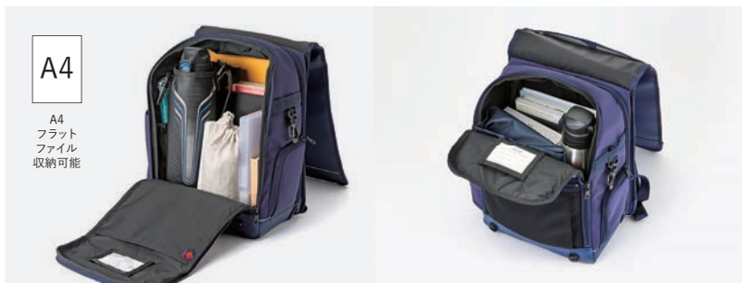
3. 全面オープンファスナー

メイン収納部分のファスナーが、コの字型にぐるりと開きます。収納スペース内の視認性が高いので、中の収納物が確認しやすく、物の出し入れもスムーズです。