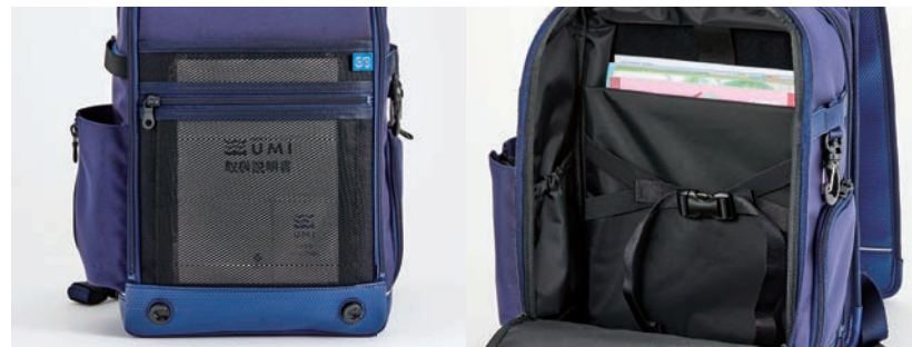
5. 視認性の高いメッシュポケット かぶせを上げると真っ先に目に入るので 大事なお知らせの手紙を見逃しません。