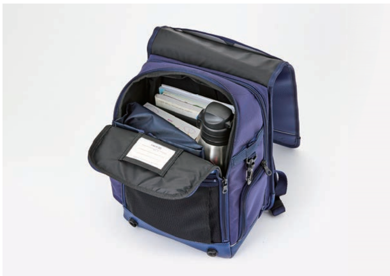
UMIなら全て収まります