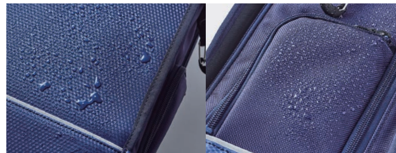
21. 耐水・防汚加工 (かぶせ・底)