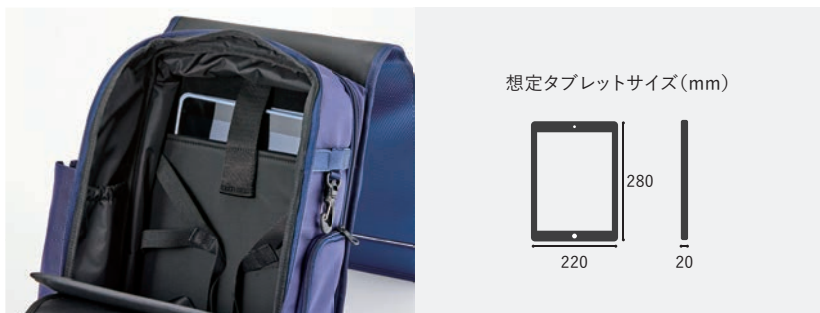
4. タブレット用ポケット

メイン収納部分のファスナーが、コの字型にぐるりと開きます。収納スペース内の視認性が高いので、中の収納物が確認しやすく、物の出し入れもスムーズです。