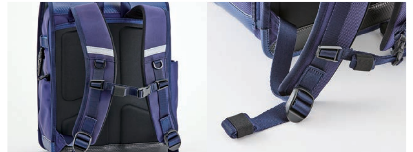
12. ショルダーがずれず 歩きやすいチェストベルト