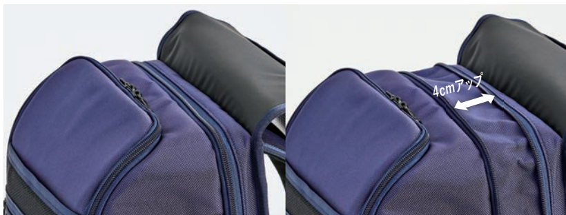
2. 拡張式オープンファスナー 最大4cmマチが広がる